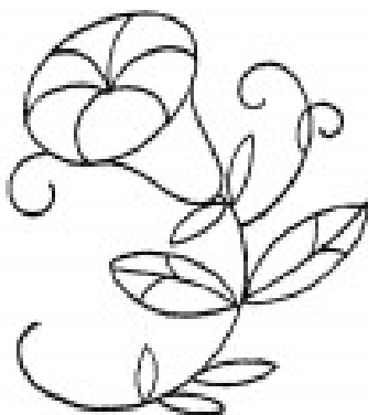
Рисунок 1 – Узор для вышивки

По краю прихватки проложите отделочную строчку на расстоянии 0,5 см.