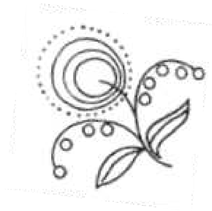
Рисунок 1 – Узор для вышивки

Детали сложить изнаночной стороной, стачать. Срез обработать швом зиг-заг.