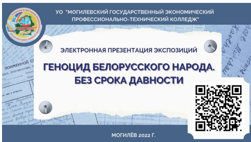
Рисунок 3 – Электронная презентация экспозиций, посвященная теме геноцида

Таким образом, музей колледжа «Спадчына роднага краю» является уникальной по форме и содержанию историко-просветительской площадкой, интегрированной в образовательный процесс. Потенциал музейных экспозиций, посвященных Великой Отечественной войне, активно используется при организации работы по формированию гражданственности, патриотизма, национальной идентичности учащихся. А вовлечение их в исследовательскую, творческую, проектную деятельность, непосредственное и активное участие в создании экспозиций, посвященных геноциду белорусского народа, экскурсий, видеоматериалов помогает подрастающему поколению, осознав масштаб трагедии, укрепить чувство ответственности за свою судьбу и судьбу страны и делать все возможное, чтобы ужасы того времени никогда не повторились.