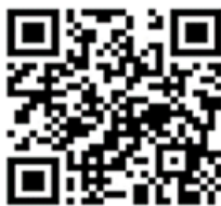
Рисунок 1 – Видеофрагмент обзорной экскурсии «Зала памяти жертв геноцида белорусского народа»

Члены творческого объединения «Могислав» под руководством педагогов разработали маршруты и тексты экскурсий по теме Великой Отечественной войны и геноцида белорусского (советского) народа, аудиогиды для самостоятельного ознакомления с залами и экспозициями, а также мобильное видео для массовой популяризации музея «Спадчына роднага краю» (рисунок 1, 2).